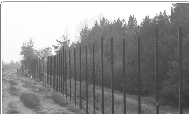
Ограждается не просто прибрежная защитная полоса, а растущий здесь молодой лес. Как говорится, два в одном...