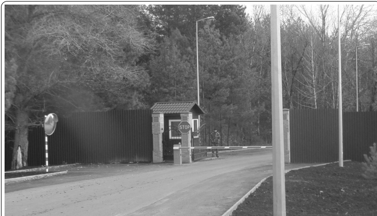
КПП на дороге, ведущей к СТ «Бобер» — в ста пятидесяти метрах от трассы Вышгород-Лебедевка