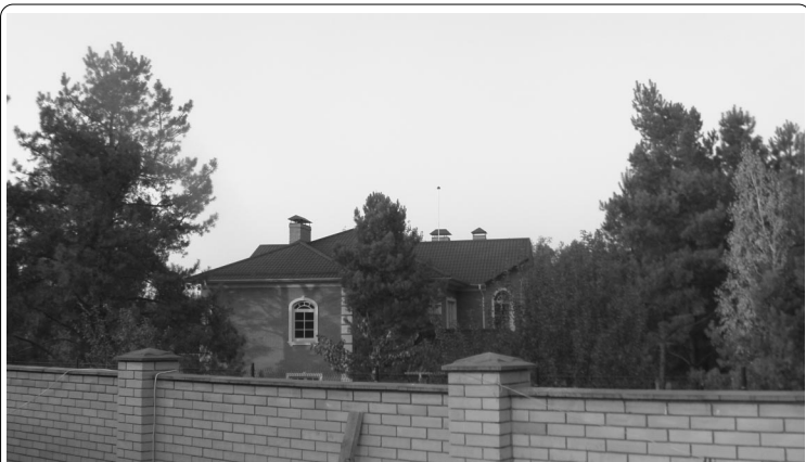
Так выглядит ближайшая к пешеходному мосту «избушка» СТ «Бобер»