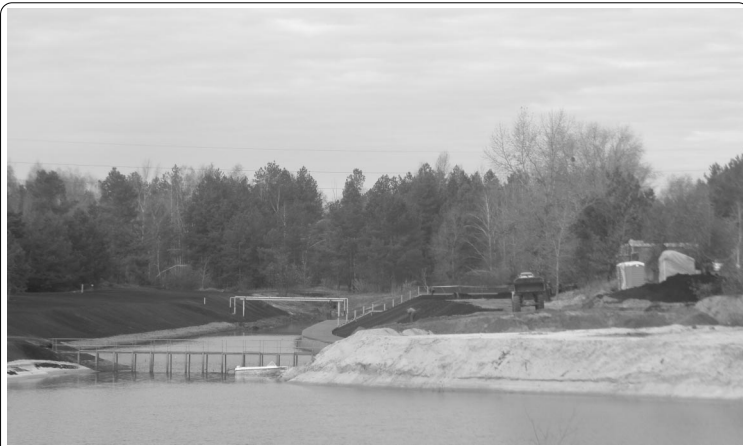
Вскоре у СТ «Бобер» появится еще и живописнейший искусственный залив. Богу — Богово, как говорится...