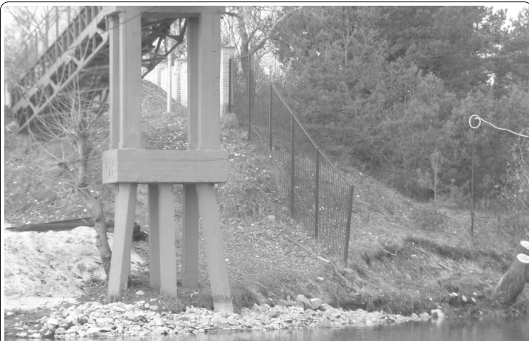
Через ограду СТ «Бобер» просто так не перепрыгнешь: свалишься в воду. Впрочем, там может быть и заминировано...