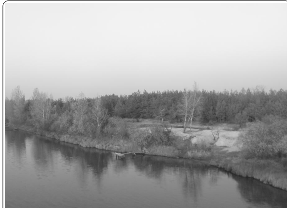
Вскоре и этот берег скроется за высоким забором. Который и защитит его от народа...