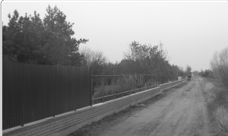
Километровый забор еще только сорушается. Интересно, за чьи кровные?