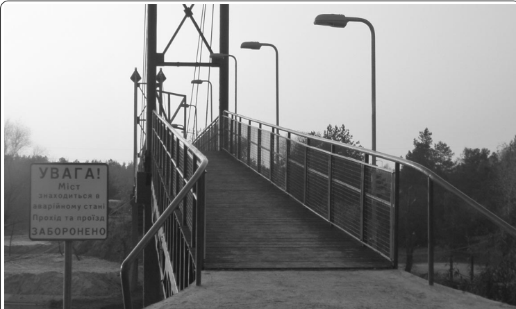
Пешеходный мост, как говорится, «с иголочки», тем не менее, табличка говорит сама за себя...