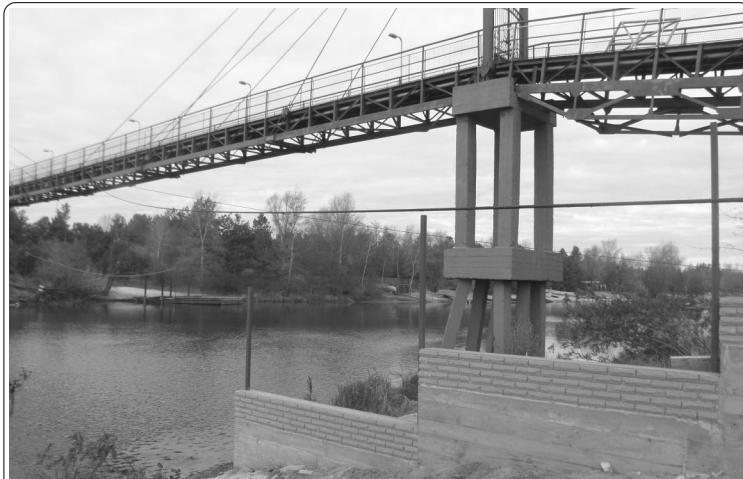
Скоро и к мосту так просто не попадешь, — только со специальным пропуском;