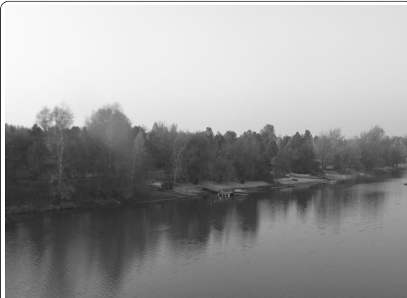
Частные пляжи СТ «Бобер». Кстати, тоже прибрежная защитная полоса...